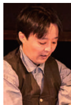
十三代目 結城孫三郎